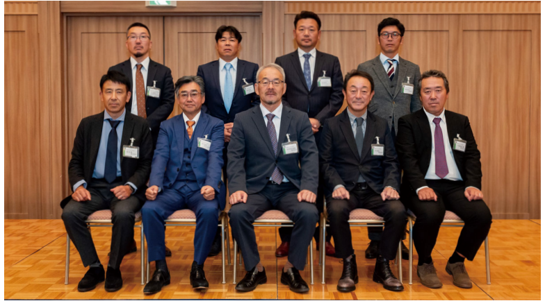
▲ニットク・アメニティシステム連合会会長賞