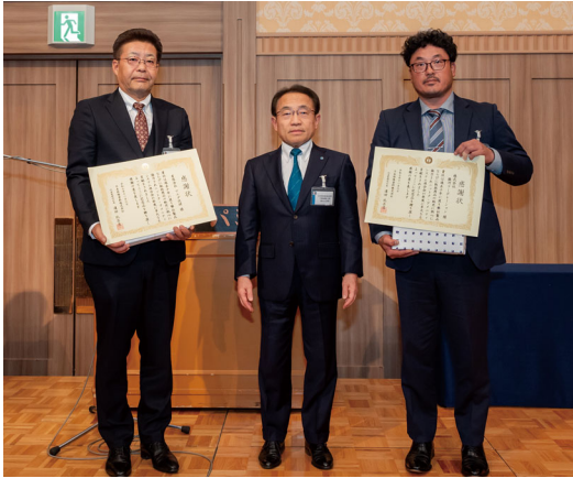
▲日本特殊塗料(株)社長特別賞