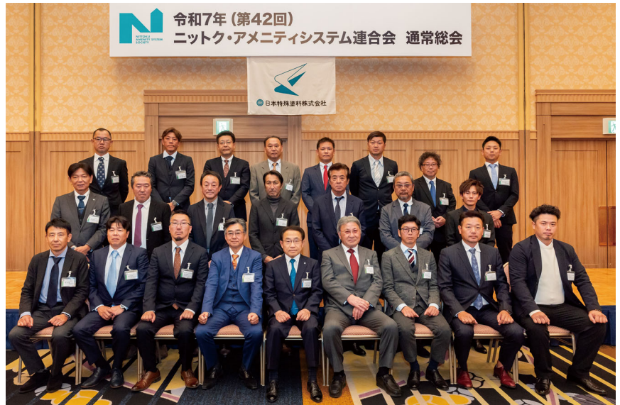
▲日本特殊塗料(株)社長賞