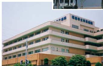
▲尾道市立市民病院